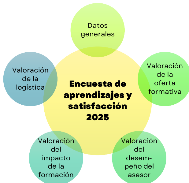
Gráfico 1. Encuesta de aprendizajes y satisfacción 2025