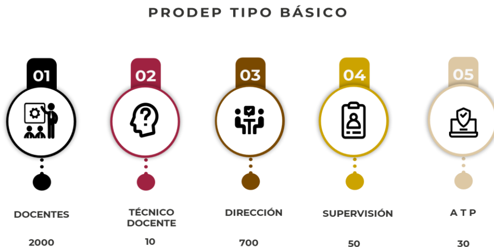
Figura 2. Docentes beneficiarios

De los resultados del año 2025, se identifica la necesidad de impulsar la formación de todas las figuras educativas con el objetivo de incrementar la eficiencia terminal y ampliar la cobertura. Con relación al personal que ejerce funciones de asesoría y acompañamiento, se promoverá que su participación en las distintas acciones de formación, fortalezcan el diálogo horizontal y la reflexión de la práctica de quienes acompaña. En este contexto y en atención a lo establecido en el anexo 13, también se dará prioridad a los docentes que laboran en contextos de vulnerabilidad.