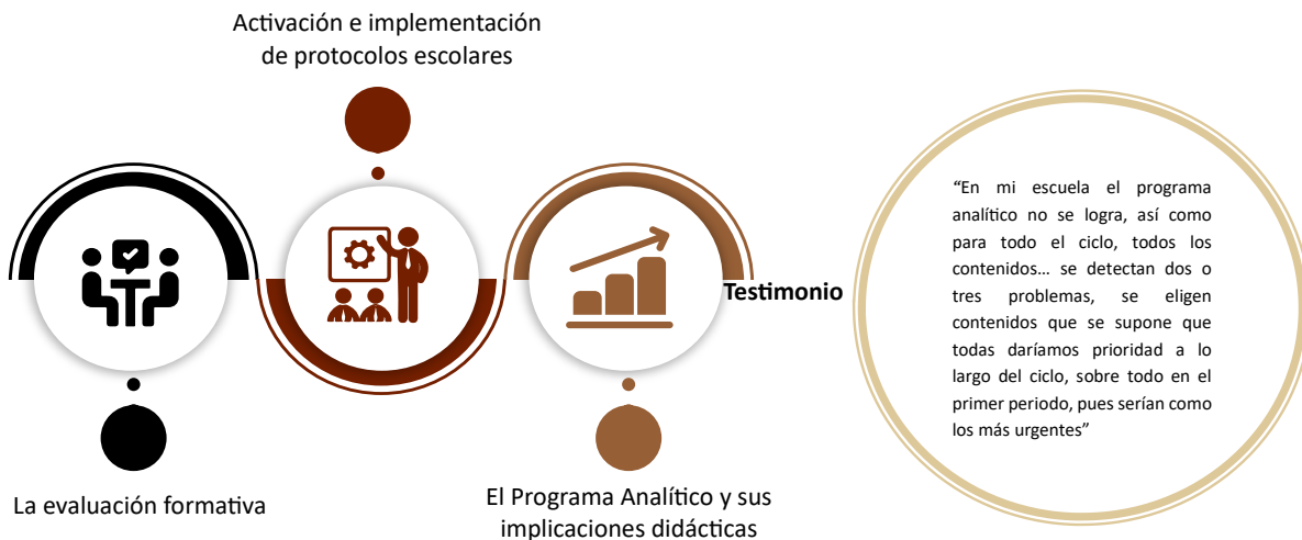
Figura 3. Temáticas de formación